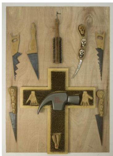
Figura 3 - “Arte aqui eu mato (Fé cega, faca amolada)”

Parece razoável pensar que, toda a estrutura de sociedade que se tem até aqui, seja ela nomeada de modernidade, pós-modernidade ou até modernidade tardia, entre outras; trata de uma construção histórica, social e ideológica. O modelo de indivíduo que se tem não é natural, mas apenas uma invenção recente (Foucault, 1999). Ao nascer recebemos uma carga histórica e ideológica a qual já se encontra na cultura, nos hábitos e no contexto de modo simbólico e concreto. Tais hábitos e imposições culturais estão atrelados a traços de ideais burgueses, escala de valores, como conceito de bem e mal, higiênico, belo e feio, forte e saudável. Foucault (1978, 1979) aponta nessa dinâmica constituída e legitimada, tanto o biopoder, referindo-se a dispositivos disciplinares (extração de energia dos corpos), instituições, escolas, fábrica e prisão e até mesmo igrejas; quanto à biopolítica, regulação das massas, taxas de natalidade, controle de migração entre outras. As figuras 3 e 4, a exemplo, registram recortes da exposição Mundo Animal de Gervane, nos provocando frente a institucionalização da fé e sua instrumentalização para a legitimação de discursos; “a fé é cega, mas a faca é amolada; pare de matar e de roubar”, mas mata-se pela hegemonia, o preconceito, o poder e o humanocentrismo extremista.