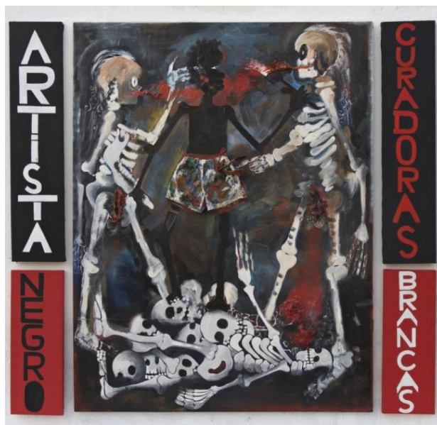
Figura 6 - “Artista negro, curadoras brancas” Óleo sobre tela, colagem, 160 x 180 cm

Parece que além das variedades de suportes e modo impactante de expressão, Gervane se coloca na produção de controvérsias, pondo os valores e discursos sociais à prova; o que parece razoável considerar seus aspectos interventórios e críticos em suas manifestações artísticas.