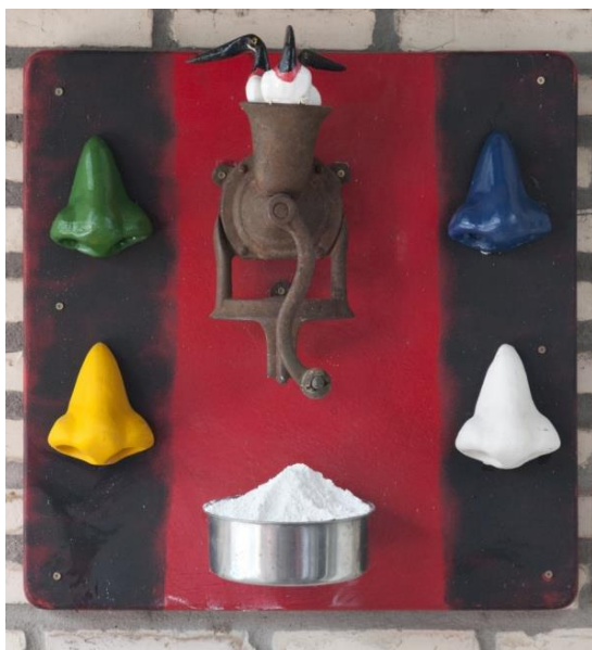
Figura 5 - “Narizes patrióticos” Objeto 70 x 70 cm

o patriotismo dissimulado; a banalização da arte regional pela figura do tuiuiu - droga de arte. A figura 6, registra um “oil on canvas” (tão conservador), mas manifestando a hegemonia da arte branco-europeia a qual muitas vezes “naifeia” a arte negra, regional e periférica. Eis aí um artista contemporâneo que faz críticas à Arte e a seus critérios de legitimação.