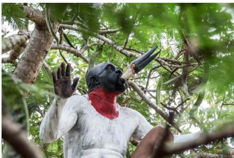
Figura 1 - “Gilberto Chateaubriand visita Cuiabá”

Nas últimas três décadas tem participado de mostras individuais e coletivas pelo país. Em 2018, Gervane foi indicado ao prêmio PIPA, um evento anual realizado pelo Instituto PIPA, um dos mais relevantes prêmios brasileiros de artes visuais, que tem por objetivo premiar e consagrar artistas já conhecidos no mercado de arte brasileiro (Prêmio PIPA, 2018). Seu trabalho tende a evocar um senso crítico e provocativo, conforme é percebido nas figuras 1 e 2, registradas na exposição Mundo Animal , tais figuras congelam no tempo a performance do artista que incorpora a ave símbolo do pantanal, o tuiuiu; a frase “eu sou você” nos provoca e nos co-responsabiliza frente ao mundo habitado pelos animais humanos e não humanos. O paradoxo mundo animal, voraz, amante, odioso, apaixonante, destrutivo e fomentador. Aqui torna bastante oportuno citar (Brandão, 2016) com suas lindas palavras que também abrilhantaram o catálogo da exposição Mundo Animal (2016): “Quando éramos humanos de um lado e animais do outro, a dor que doía de lá não se suspeitava de cá. A névoa se dissipou, estamos todos do mesmo lado”.